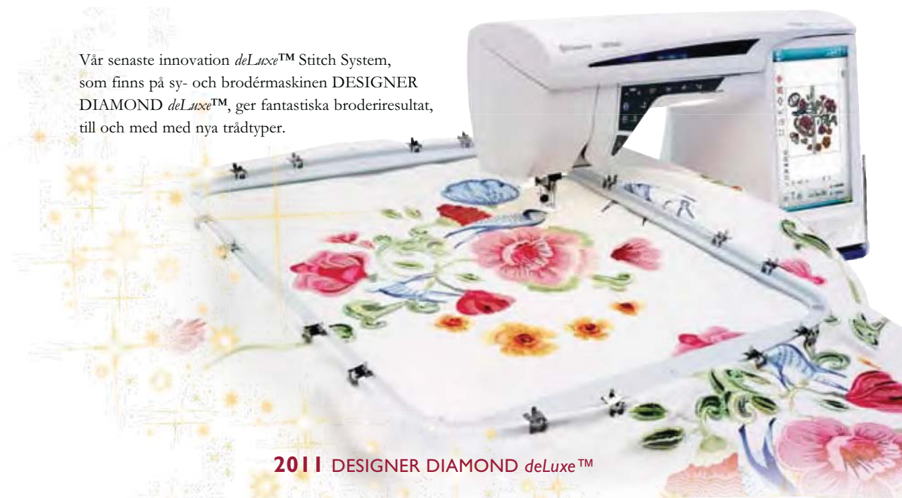
2011 DESIGNER DIAMOND deLuxe™

Vår senaste innovation deLuxe™ Stitch System, som finns på sy- och brodermaskinen DESIGNER DIAMOND deLuxe™ , ger fantastiska broderiresultat, till och med med nya trädtyper.