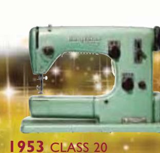
1953 CLASS 20