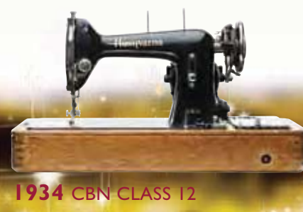
1934 CBN CLASS 12