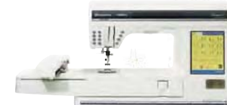
1998 DESIGNER I™