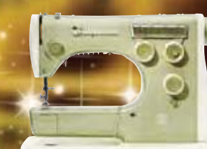
1960 MODEL 2000