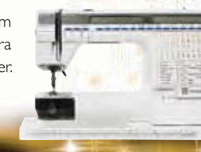
1989 MODEL 1100

Gå till www.husqvarnaviking.com om du vill veta mer om våra tidigare produkter.