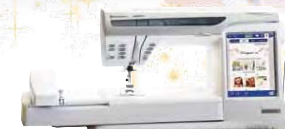
2004 DESIGNER SE™