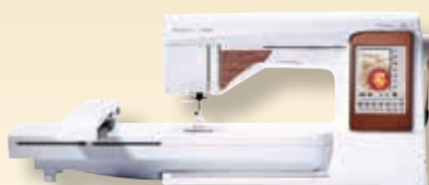
DESIGNER TOPAZ™ 50