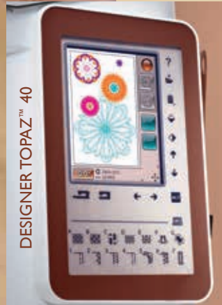
DESIGNER TOPAZ™ 40

* Finns på båda maskinerna. Förstklassig på DESIGNER TOPAZ™ 40-maskinen, jämfört med de främsta konkurrerande symaskinerna i samma prisklass.