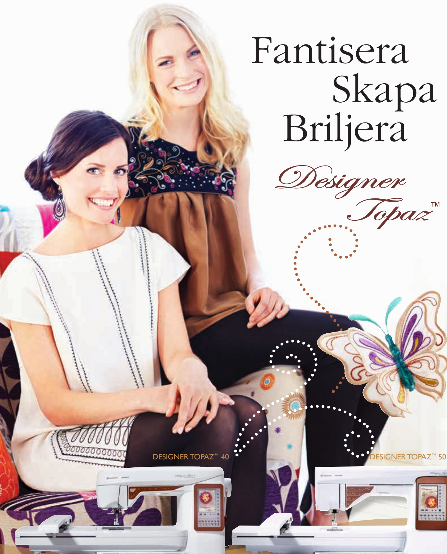
DESIGNER TOPAZ™ 40