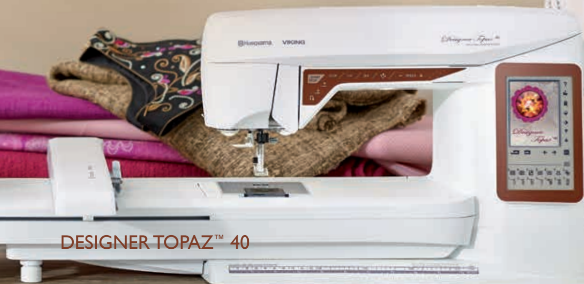
DESIGNER TOPAZ™ 40

DESIGNER TOPAZ™ sy- och brodermaskin har en redigeringsfunktion för broderier på skärmen som är imponerande! Spegelvänd, rotera och ändra storlek på broderierna. Kombinera med andra motiv och personlig text. Ändringarna syns direkt på skärmen. Spara dina personliga kombinationer och ändringar.