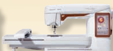
DESIGNER TOPAZ™ 40