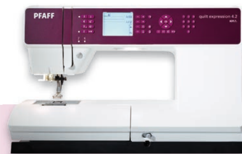
quilt expression™ 4.2