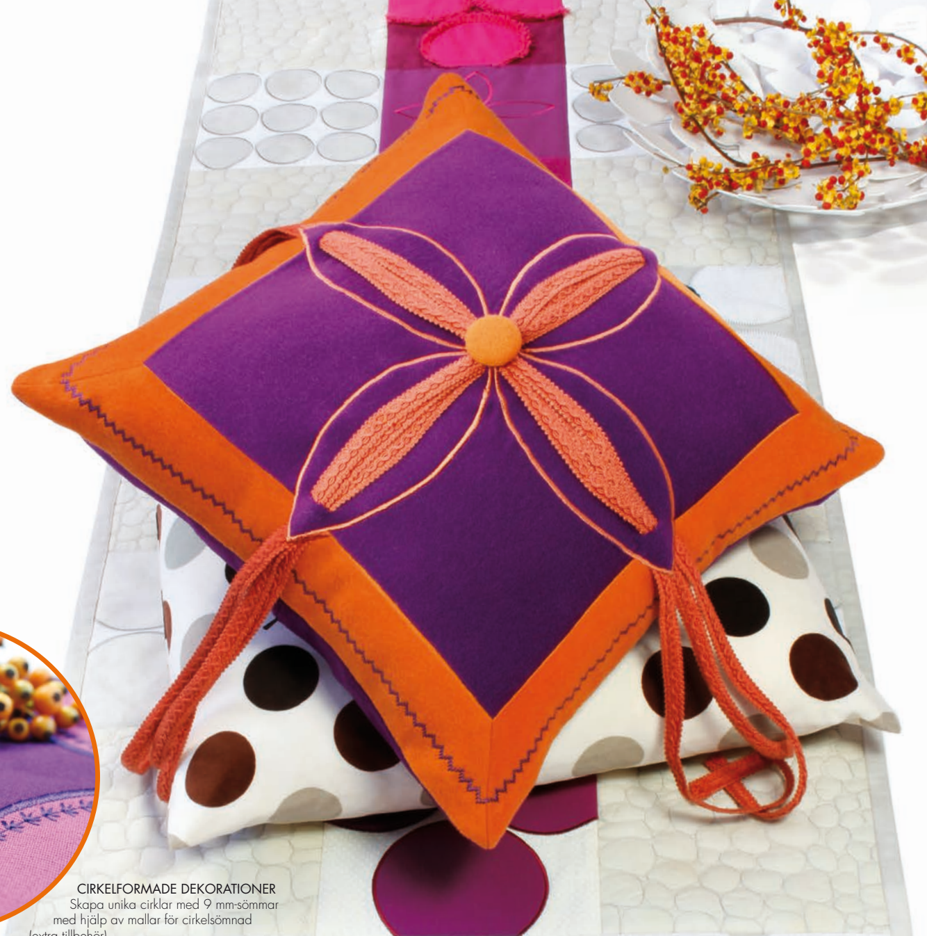
CIRKELFORMADE DEKORATIONER Skapa unika cirklar med 9 mm-sömmar med hjälp av mallar för cirkelsömnad (extra tillbehör).

Sömnadsinstruktioner för den exklusiva PFAFF®-quiltan samt tips och tricks för designkudden finns på www.pfaff.com